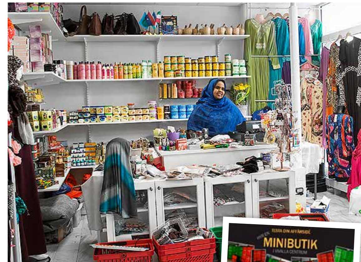
MINIBUTIK. Ett sätt att prova en affärsidé.

Besöksadress: Argongatan 99 B Örebro Telefonnummer: 016-16 46 00 Webbsida: www.vasterporten.se