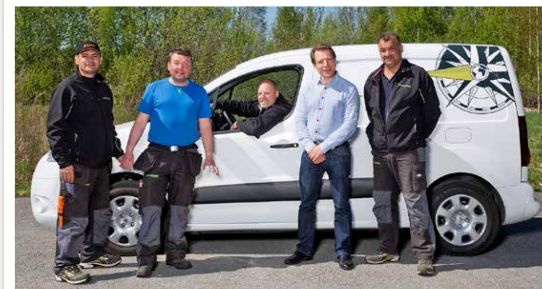
DÖRRÖPPNARE. Genom ett års utbildning och praktik i yttre fastighetsskötsel på Västerportens "Plantskola" öppnas fler möjligheter att komma in på arbetsmarknaden.

- På sommaren lär man sig bl.a. hur grönytemaskiner fungerar. Man klipper gräs, sköter buskar och rabatter. På vintern är det mest maskinvård och snöskottning mm. Varje år deltar omkring 5 personer i utbildningen. Många har gått vidare till jobb efter att Västerporten "öppnat dörrar" för dem, inte sällan hos våra egna entreprenörer. Statistiken talar sitt tydliga språk 66% går vidare till ett jobb.